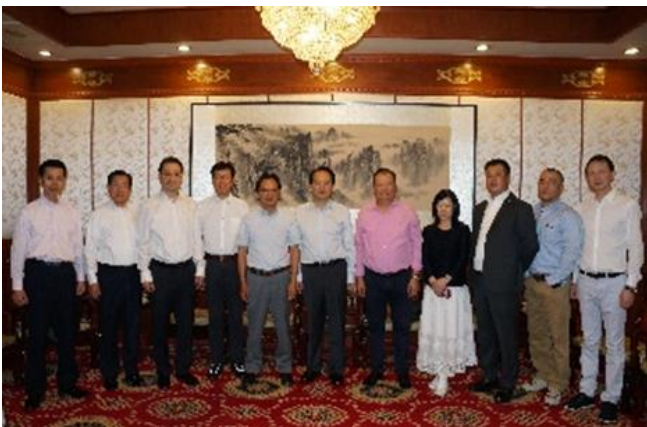
中央统战部谭天星副部长及各位领导接见总商会 考察团

日本中华总商会自 2009 年以来一年一度，一年一省地组织回国考察活动。在本次考察伊始，中共中央统战部副部长暨国务院侨务办公室副主任谭天星先生及各位领导接见了总商会考察团一行。谭副部长代表中央统战部暨国侨办对总商会考察团一行表示热烈欢迎和诚挚问候，并高度评价总商会作为日本最有影响力的华人经济团体，多年来为服务华社，推动侨胞事业贡献良多，同时也为增进日本各阶层对中国的了解，促进中日两国经济技术交流合作及民间友好往来等作出了积极努力。谭副部长同时表示，中央统战部暨国侨办将一如既往地关心海外侨胞，重视保障侨胞的权益。当天，谭副部长及各位领导还在和平门全聚德宴请了考察团一行。