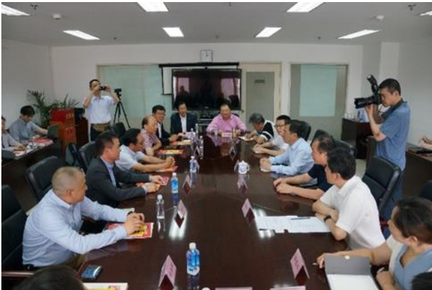
北京市侨办领导接见总商会考察团