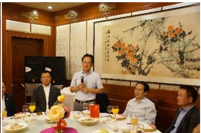
谭天星副部长及各位领导宴请考察团一行

严浩会长对谭副部长百忙中的接见、对中央统战部、国务院侨办一直以来对总商会的关心和指导表示由衷的谢意，并表示总商会为促进中日民间经济交流继续努力。同时，介绍了近年包括回国考察在内的总商会加强与祖国联系互动的活动，并诚挚邀请谭副部长等领导参加预定于 2020 年春季举办的总商会成立 20 周年庆典。谭副部长欣然应邀，并表示“在工作安排允许情况下力争参加”。